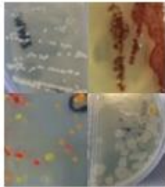
Figura 1 Cepas aisladas de suelo contaminado con diésel.

En el presente estudio, siete cepas fueron aisladas de diferentes sitios contaminados por diésel y gasolina en la ciudad de Torreón, Coahuila. Estas cepas fueron las que mejor se adaptaron a un medio MMS con el hidrocarburo como única fuente de carbono (Figura 1).